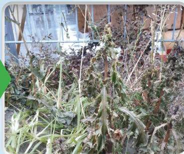
Distel 2 dagen na behandeling