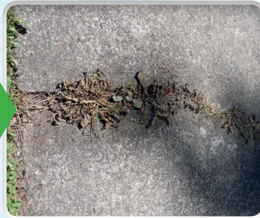
Onkruid op trottoir 2 dagen na behandeling