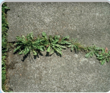
Onkruid op trottoir

Omdat het waterverbruik per persoon tot slechts 4 per minuut is te reduceren is met een watertank van 2000 ltr. en zonder bijvullen een werktijd tot 8 uur mogelijk(!). Met de "Water-intake module" (pomp / filter / zuigslang) is de watertank overall en op een uiterst eenvoudige manier bij te vullen.