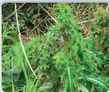
Distel vóór behandeling